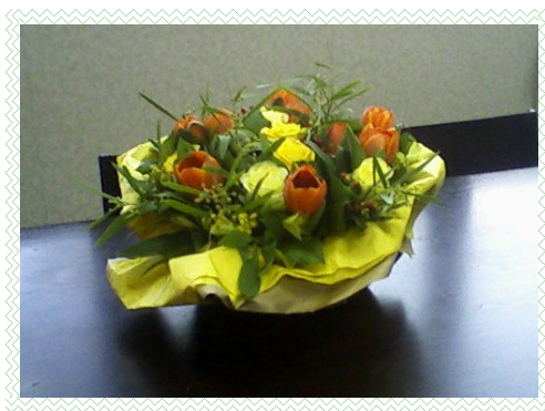
(Bouquet LEA.B - C.C. Chevry II Gif sur Yvette)

Nous remercions Hamid Boulenouar pour cette belle composition florale offerte à l'Adezac à l'occasion des voeux